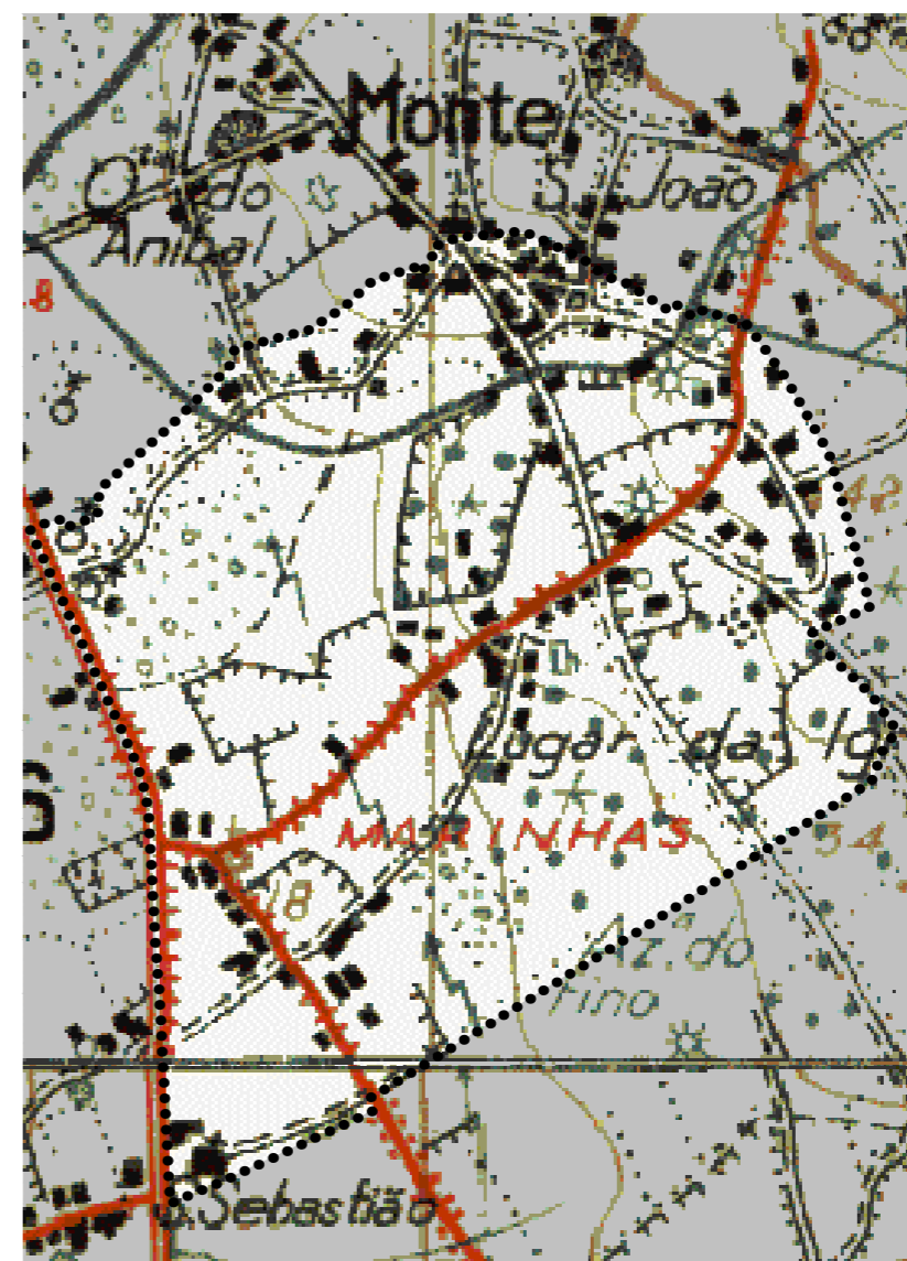
Extrato da Carta Militar , 1ª série , 1948